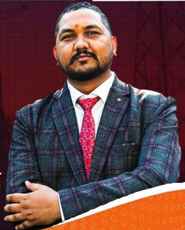
Raman sir Electrical Engg. Expert

UPPCL-JE, SSC-JE RRB-JE PGCIL-DT, DFCCIL-JE, ITI Etc.